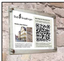
Schild mit QR-Barcode

Barcode auf diesem Flyer oder dem Schild über dem Naturstein mit Smartphone aufnehmen