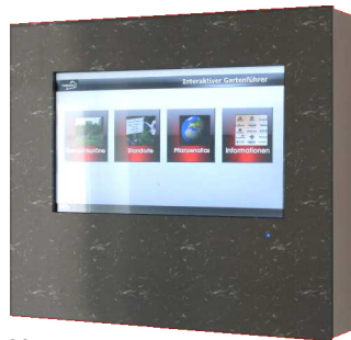
Marmormuster mit Rahmen aus furniertem Holz

PC hinter Edelstahlfront mit Rahmen aus Kirschholz. Alle Bedienelemente und Anschlüsse sind hinter der Abdeckung versteckt.