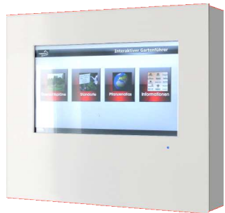
Weißes Plexiglas mit Rahmen aus lackiertem Holz